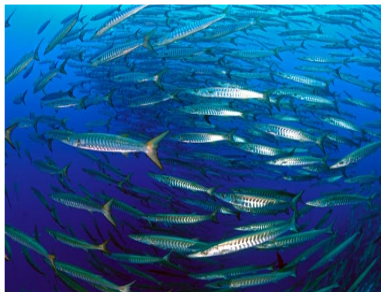
Scholen barracuda's zijn hier geen zeldzaamheid.