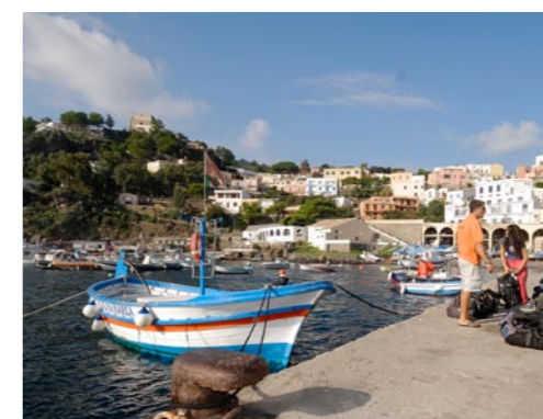
Met de klok mee: De 'gozzo' boven de kleurrijke duikplaats.