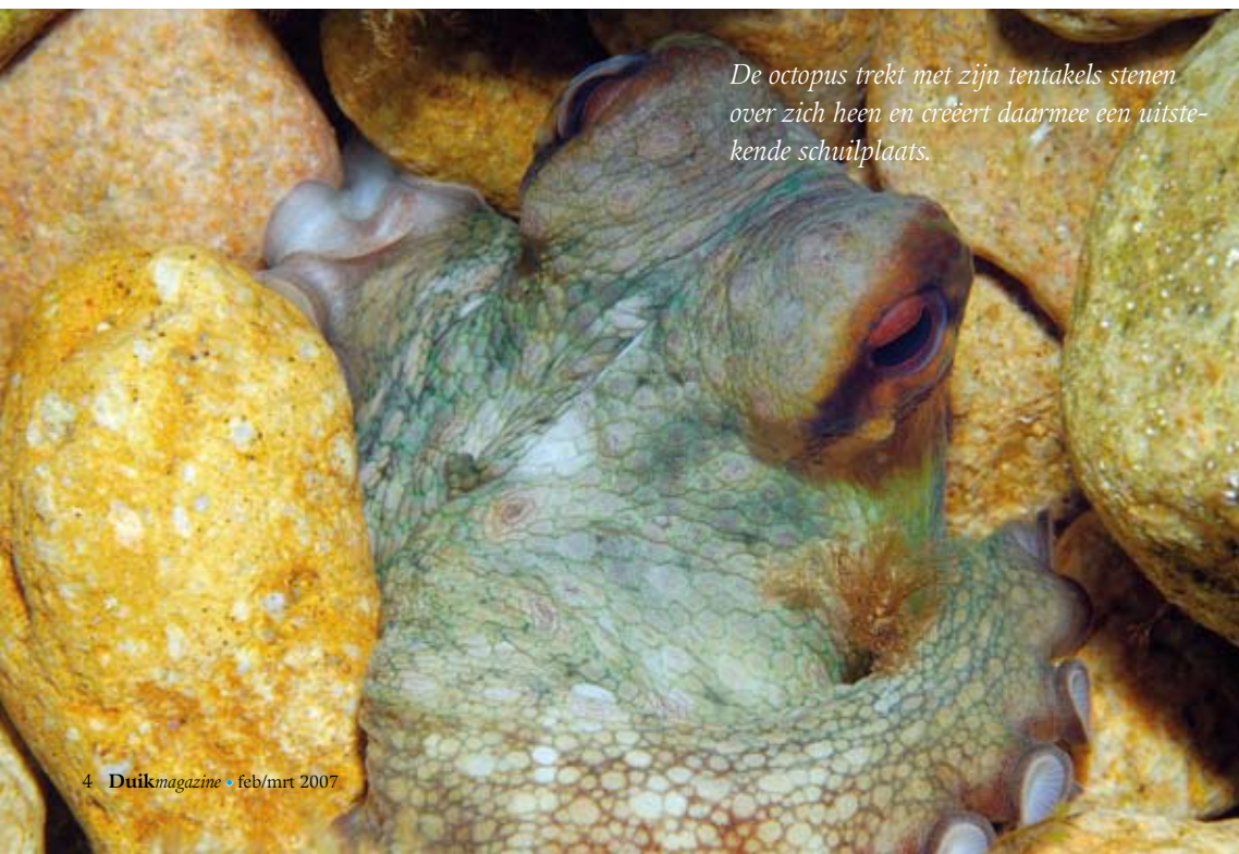
De octopus trekt met zijn tentakels stenen over zich heen en creëert daarmee een uitstekende schuilplaats.

Om de baai van Tamariu te kunnen bereiken, neem je de linkerkant van de baai. Vanaf het strand zwem je onderwater langs de rotspartijen langzaam