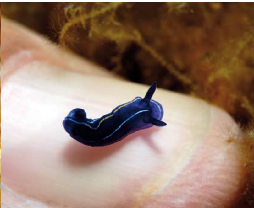
Als je niet weet hoe klein naaktslakken kunnen zijn, zie je ze over het hoofd. Sommige zijn slechts enkele millimeters groot.

Toen ik met mijn vinger over de kaart de kustlijn volgde, stuitte ik op de namen Aiqua Xelida, Aiqua Brava, Sa Tuna, Aiqua Freda en veel andere plaatsen die zich volgens de kaart zouden lenen voor een kantduik. Ik zocht namelijk naar plekken op de kaart waar de weg en de kustlijn elkaar raken zodat het water met duikspullen eenvoudig te bereiken is.