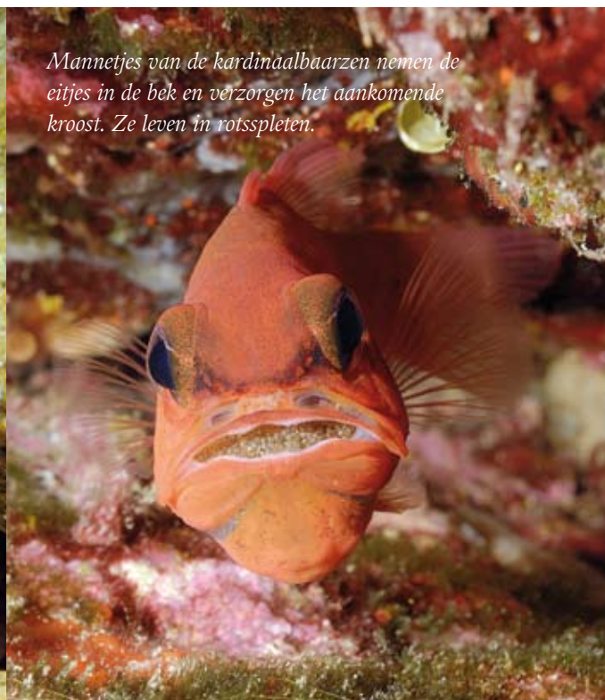
Mannetjes van de kardinaalbaarzen nemen de eitjes in de bek en verzorgen het aankomende kroost. Ze leven in rotsspleten.